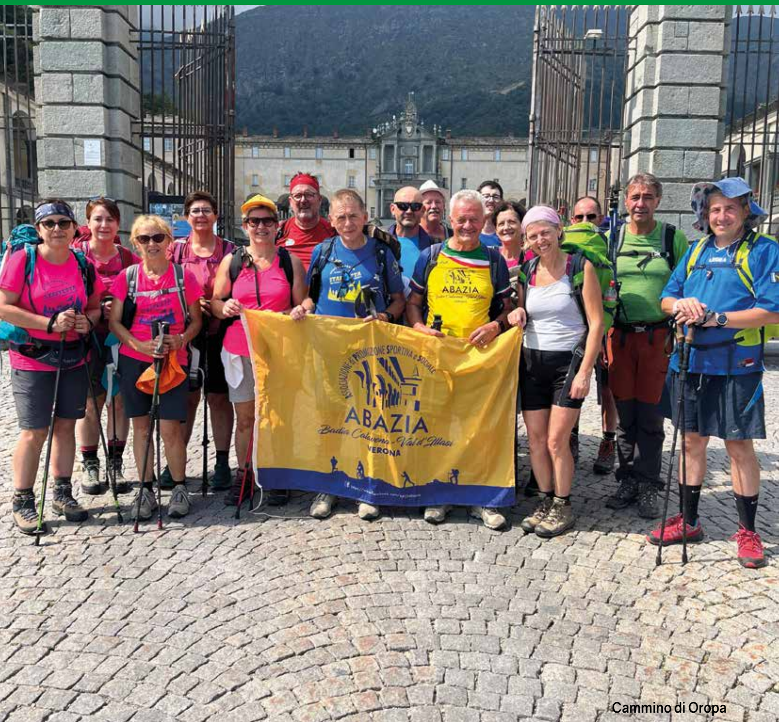
Cammino di Oropa

Notiziario dell'Associazione Abazia apss-Badia Calavena Val d'Ilasi-Verona